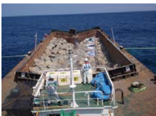
⑧ 石材投入確認状況