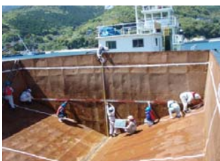
⑧ 海底山脈石材投入船の空船寸法確認状況