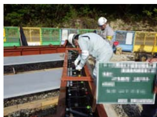
② 魚礁ブロック配筋確認状況