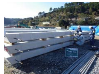
② 出来形部材確認状況