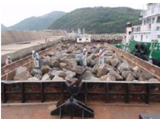
⑧ 石材(1.0t内外)検収段階確認状況