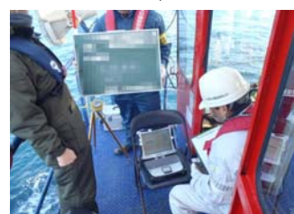
② 沈設位置確認状況