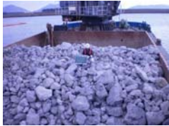
②-5m岸壁基礎工 捨石(無選別)段階確認状況