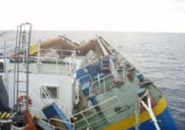
①ブロック投入確認状況