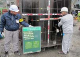
①魚礁ブロック配筋段階確認状況