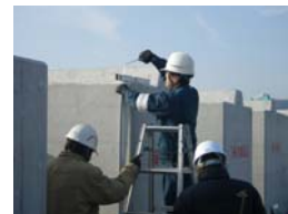
②防波堤(改良) 方塊出来形確認状況