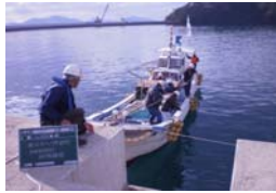
②-5m岸壁基礎工 捨石(無選別)荒均し 段階確認状況