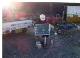
②防波堤(改良) 方塊コンクリート スランプ確認状況