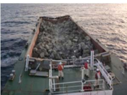
②石材投入確認状況