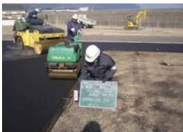
②舗装工 温度測定確認状況

①深江漁港地域自主交付金工事積算業務委託1式 ②深江漁港地域自主交付金工事監督業務委託1式 ③布津漁港地域自主交付金工事積算業務委託1式 ④布津漁港地域自主交付金工事監督業務委託1式