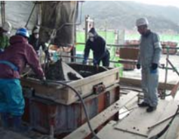
①石炭灰コンクリート打設確認状況